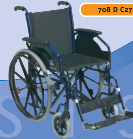
708 D C27