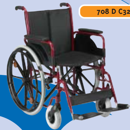
708 D C32