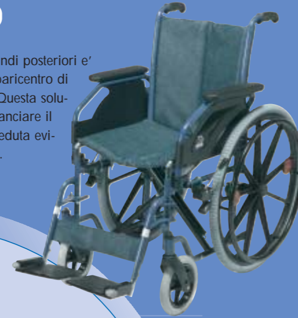
708 D kit T30

L'asse delle ruote grandi posteriori è arretrato rispetto al baricentro di qualche centimetro. Questa soluzione consente di bilanciare il peso della persona seduta evitando il ribaltamento.