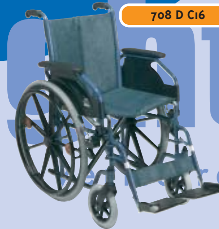
708 D C16