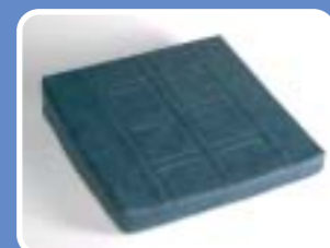
B26 - 27