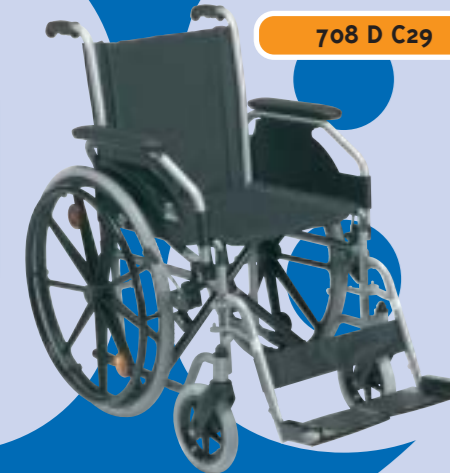
708 D C29