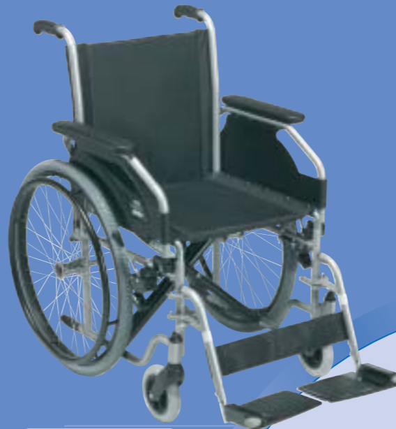
708 D kit AMP

L'asse delle ruote grandi posteriori è arretrato rispetto al baricentro di qualche centimetro. Questa soluzione consente di bilanciare il peso della persona seduta evitando il ribaltamento.