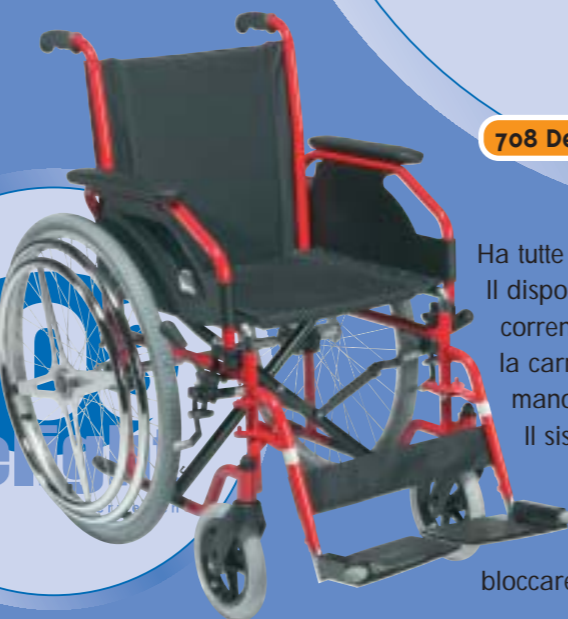
708 Delight Hem2

Ha tutte le caratteristiche del modello base. Il dispositivo di spinta che ha i due mancorrenti su una sola ruota permette che la carrozzina venga spinta con una mano sola da una persona emiplegica. Il sistema monoguida può essere facilmente montato a destra o a sinistra della carrozzina. Un sistema speciale di freno consente di bloccare le due ruote con una sola mano.